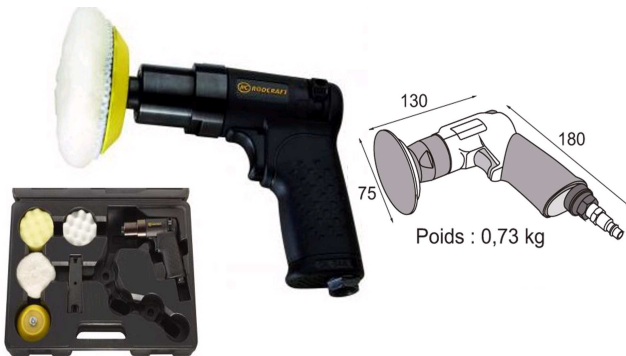
Poids : 0,73 kg