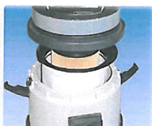
Système double filtre pour micro particules (cartouche papier + filtre synthétique)