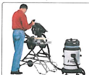
Les modèles AS282K et AS382L sont équipés de cuve ABS de grande capacité (72l).