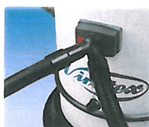
Connecteur pour le branchement simultané de deux machines (Code 8299173)